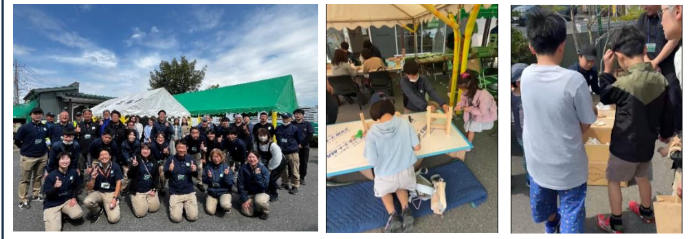
手伝ってくれたスタッフ・協力業者さん 多くのお子さまも来場してくれました

しらいし春マルシェ開催報告とお礼 4月25日(土)に「春マルシェ」も開催いたしました。昨年からはまったこの試みも今回で2回目を迎えることができました。このマルシェは、秋の地域感謝祭「白石工務店祭り」と同様に、近隣の皆さまや工事もさせていただいたお客様へ、日頃の感謝をお伝えするために企画したイベントです。当日は、昨年の秋祭りを上回るほど多くの方にご来場いただき、驚きとともに感謝の気持ちでいっぱいです。お世話になっている皆さまとお話を楽しみ、私たちスタッフにとっても「ご褒美」のような幸せな時間となりました。